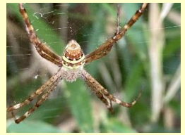
コガタコガネグモ