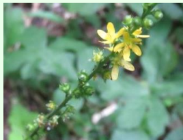
ヒメキンミズヒキ