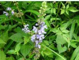
アキノタムラソウ