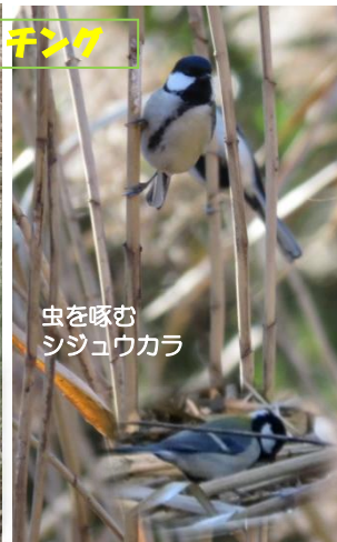
虫を啄む シジュウカラ