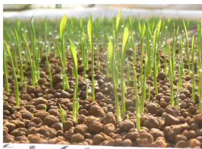
長さ2cmに育ちました(4月9日)