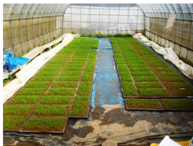
ハウスの中のようなす(4月14日)