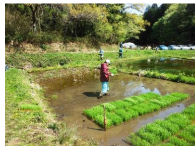
まもなく苗を苗代に移します